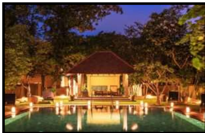
ジェットウイング アーユルヴェーダ パビリオン